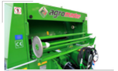
Kolay File Takma Sistemi