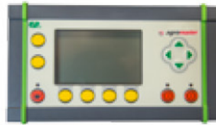
Kabinden Balya Kontrolünü Sağlayan Kumanda Sistemi

Makinanın tüm hareketleri akustik ve optik sinyalizasyon mekanizması sayesinde traktör kabininden kumanda ile kontrol edilebilmektedir.