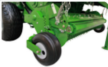
Ayarlanabilir Tabla Destek Tekerli

* Üretici bu veriler üzerinde bilgi vermeden değişiklik yapma hakkını saklı tutar.